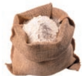
farinha de trigo